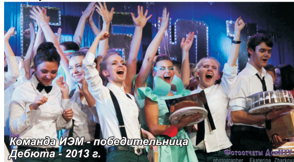
Команда ИЭМ - победительница Дебюта - 2013 г.

Шоу-балет неоднократно бывал в зарубежных поездках, он отмечен многочисленными дипломами и грамотами фестивалей эстрадного искусства.