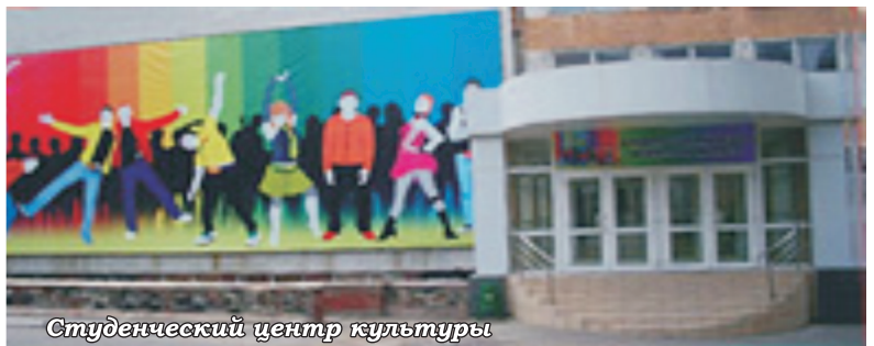
Студенческий центр культуры

Донецкий национальный технический университет не только крупный центр образования и науки. В вузе созданы все условия для раскрытия творческого и спортивного потенциала молодежи. В ДонНТУ действуют художественные и спортивные коллективы с многолетней и славной историей, в музее истории ДонНТУ постоянно проводятся выставки творческих работ студентов и сотрудников.