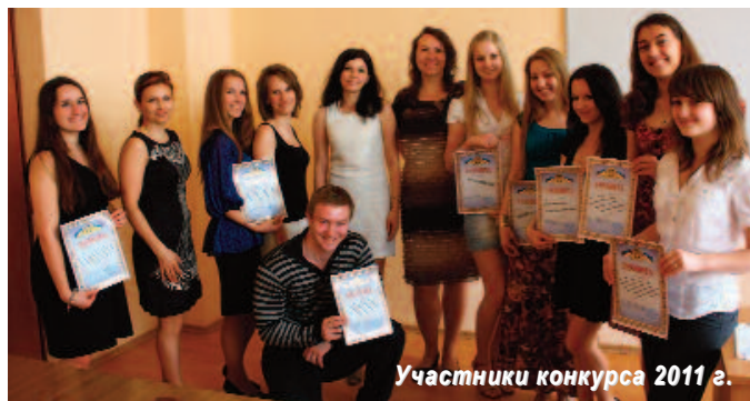
Участники конкурса 2011 г.