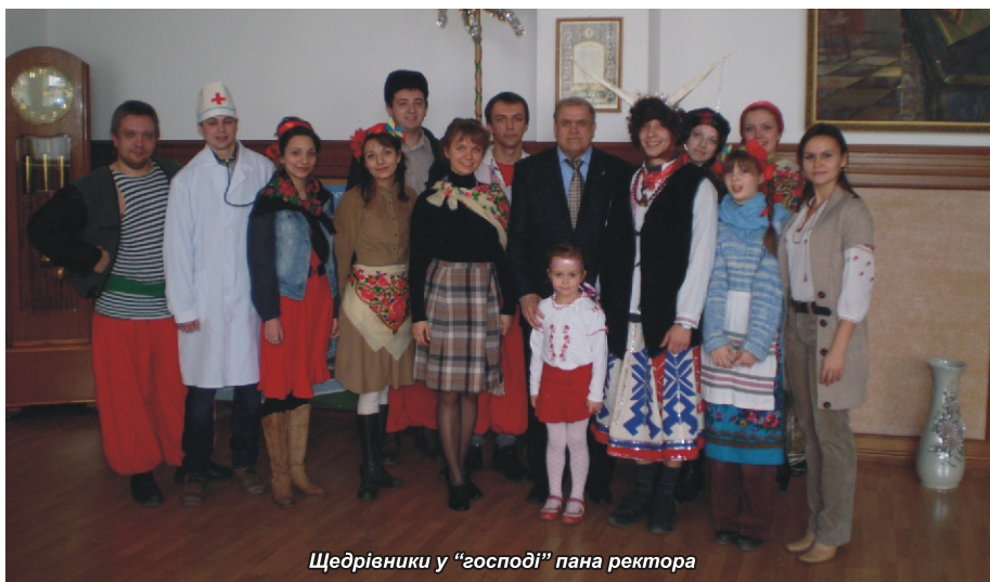
Щедрівники у "господі" пана ректора

Щедрування - давній (дохристиянський, а потім і християнський) звичай новорічних обходів, під час яких щедрівники піснями славлять господарів, бажають їм здоров'я й достатку, за що отримують смачну подяку. Студенти та викладачі Польського факультету співали, танцювали, представляли традиційні сюжети та дивували господарів. Зайшли у "хату" відділу кадрів, у "маєток" відділу міжнародного співробітництва, у "світлицю" юридичного відділу, заспівали у "садибі" гірничого та гірничо-геологічного факультетів, у інших господарів та навіть у "господі" пана ректора 😊. Бажали щастя, здоров'я, достатку, злагоди та добробуту.