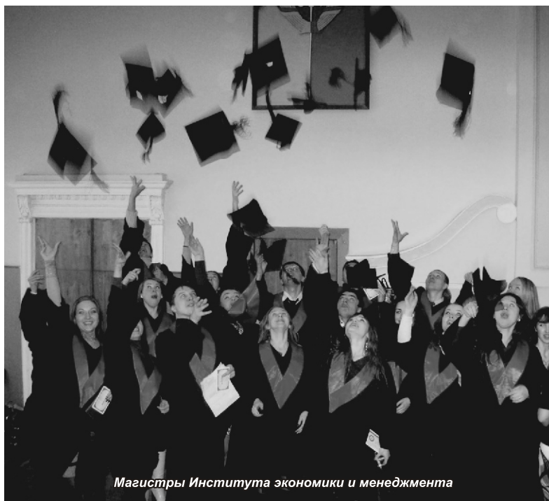
Магистры Института экономики и менеджмента