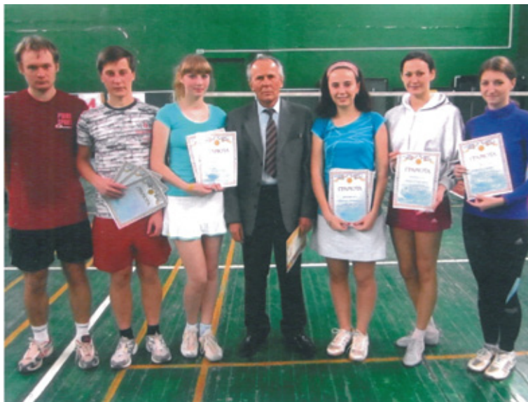
Команда-победительница со своим тренером