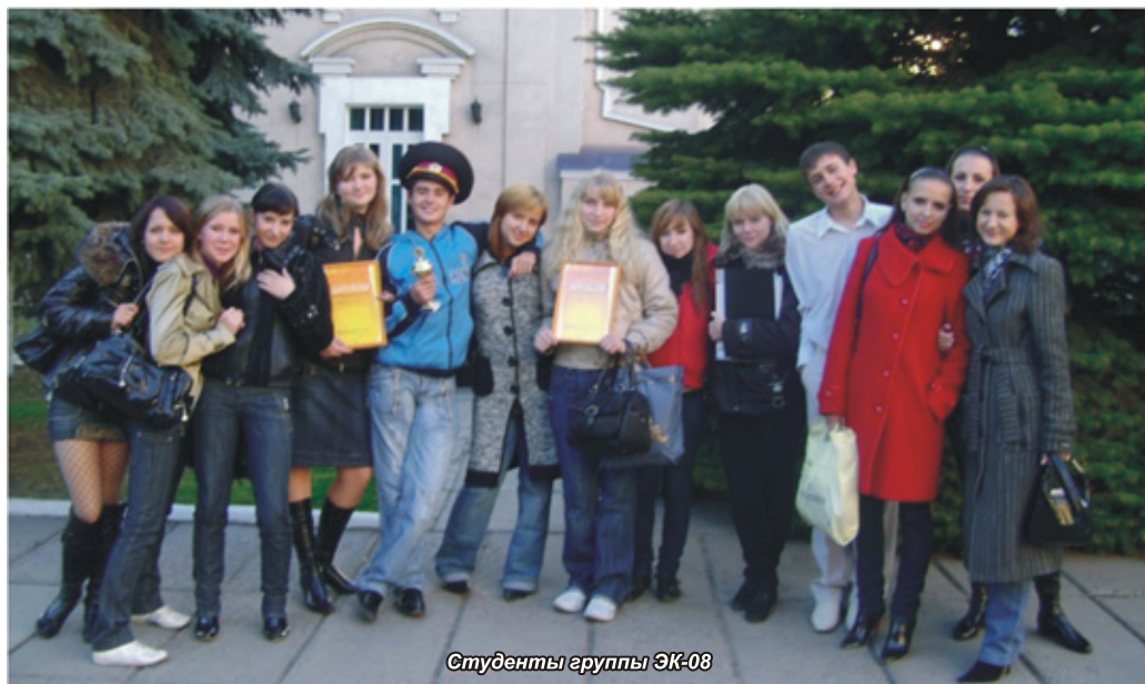
Студенты группы ЭК-08

По итогам зимней сессии названо восемь лучших академических групп ДонНТУ, из них четыре находятся в Институте информатики и искусственного интеллекта. В одной из них - группе ЭК-08 - насчитывается 21 студент, и все они не только успешно учатся (при стопроцентной успеваемости качественный показатель составляет 81 %), но преуспевают и в других делах. Материал об этой группе читайте на 3-й стр.