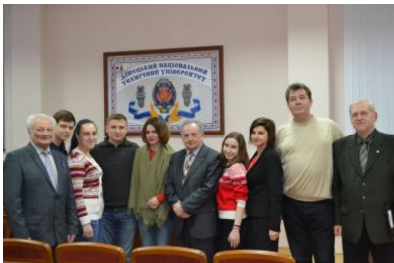
Организаторы, участники и гости конкурса

Просмотр видеороликов не оставил сомнений, что студенты действительно любят ДонНТУ и благодарны преподавателям за терпение, выдержку и преданность родному вузу. А мы гордимся нашими студентами, такими творческими и талантливыми! Благодарим всех ребят за участие, а ФКНТ поздравляем с заслуженной победой!