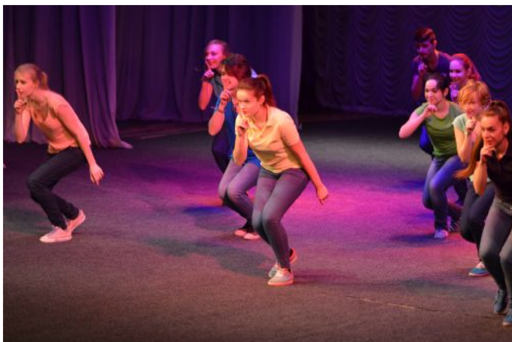
Танцевальный коллектив студентов

Отдельно хочется отметить талантливые творческие студенческие коллективы, которые украсили это мероприятие и привнесли в него искру юношеского задора и юмора. Это команда КВН «Латте», шоу-балет «Скрим», вокальные ансамбли и гимнастический дуэт с номером «Матрица».