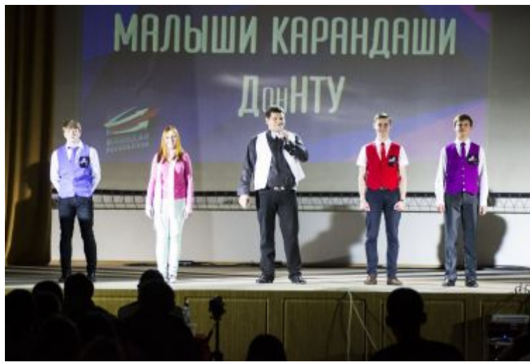
Команда КВН «Малыши-карандаши»

Хотелось бы отметить, что в зале царил очень доброжелательная и непринужденная атмосфера, зрители не скупились на аплодисменты, щедро награждая ими команды. Заслуженные овации заслужил и гитарист, виртуозным исполнением испанских мотивов которого наслаждался зал, пока жюри совещалось. Он настолько понравился зрителям, что несколько раз выходил играть на бис.