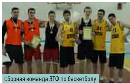
Сборная команда ЭТФ по баскетболу