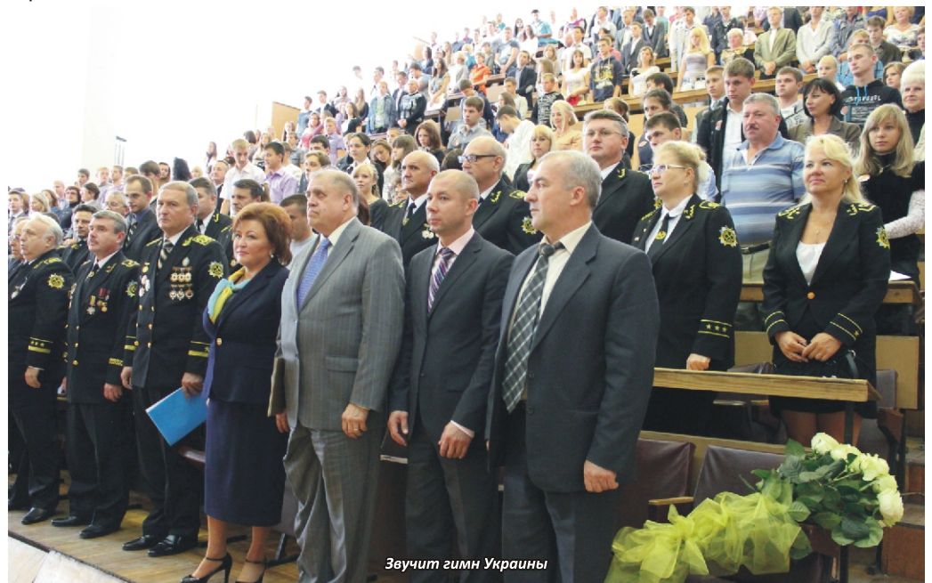
Звучит гимн Украины

но и ректора с присвоением ему высокого звания Героя Украины. В своем выступлении она подчеркнула, что Президент Украины В.Ф.Янукович одним из главных приоритетов своей политики считает молодежную, ибо от молодежи во многом будет зависеть будущее развитие нашей страны.