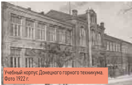
Учебный корпус Донецкого горного техникума. Фото 1922 г.

Донецкий национальный технический университет – первое высшее учебное заведение в Донбассе. Он был основан 30 мая 1921 года. За период существования вуза его название менялось несколько раз. Первоначально он назывался Донецкий горный техникум (1921-1926 гг.), затем Донецкий горный институт (1926-1935 гг.), Донецкий индустриальный институт (1935-1960 гг.), Донецкий политехнический институт (1960-1993 гг.), а позже вуз обрел статус университета.