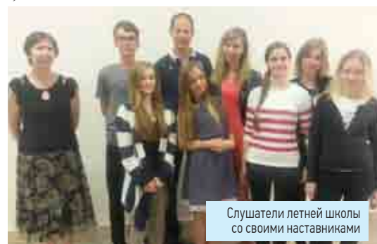
Слушатели летней школы со своими наставниками