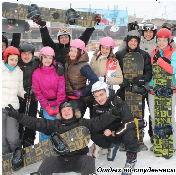
Отдых по-студенчески - это здорово!