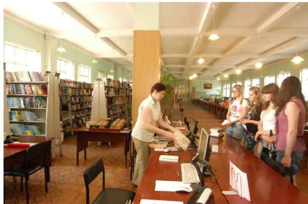
Автоматизированное обслуживание в большом читальном зале

Сегодня, благодаря компьютерным технологиям, сотрудники библиотеки ДонНТУ используют в своей