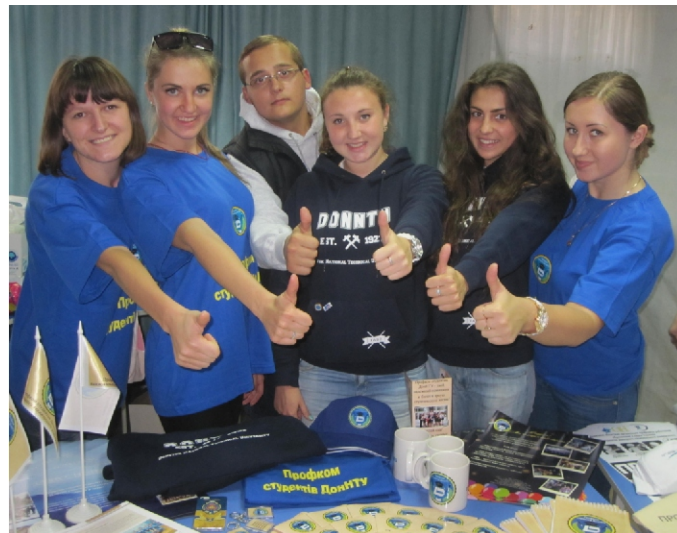
Команда наших профактивистов на Форуме лидеров студенческих профсоюзных организаций и органов студенческого самоуправления

Будь в курсе всех событий, происходящих в вузе группа ВК «Афиша ДПИ» - http://vk.com/afisha_dpi