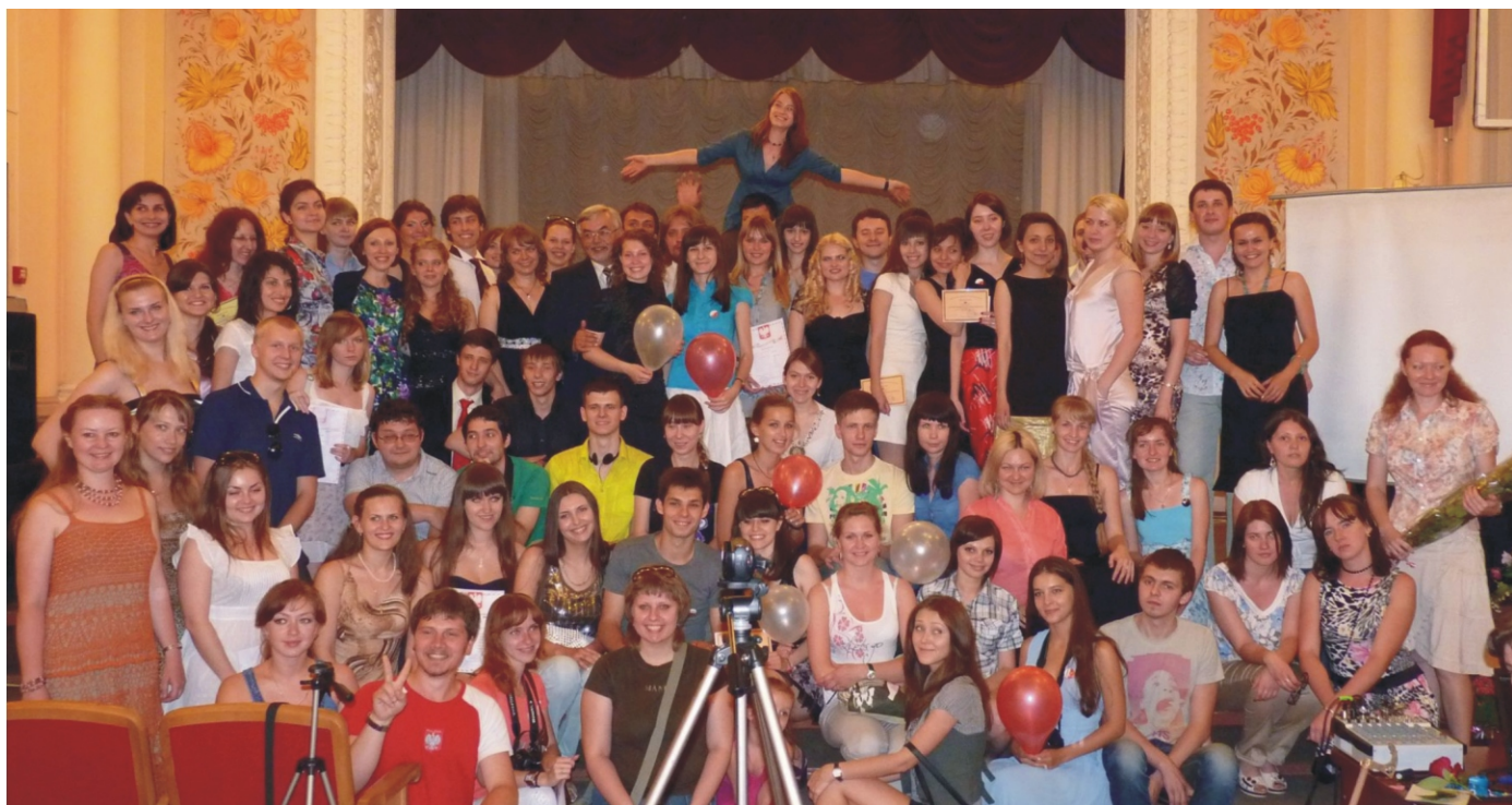
Нам десять років і це ми - Польський технічний факультет ДонНТУ