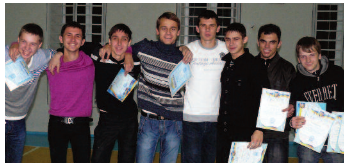
Команда ФКНТ - победительница баскетбольного турнира

Вслед за вышеперечисленными состязаниями прошла спартакиада «Первокурсник» по баскетболу, в которой приняли участие новобранцы пяти факультетов. Каждая команда должна была сразиться друг с другом, после чего и должен был определиться чемпион. Очки команды набирали следую-