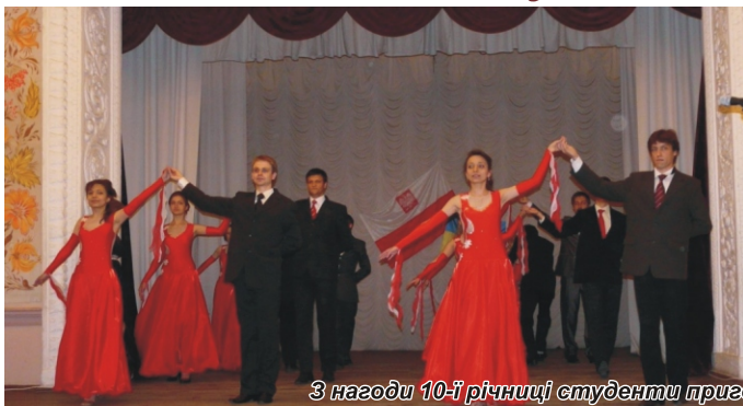
З нагоди 10-ї річниці студенти приготували великий святковий концерт