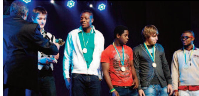
Украинские и иностранные студенты вместе праздновали День ФКНТ

танцем в стиле бурлеск. В исполнении лучших певцов факультета прозвучало мно-