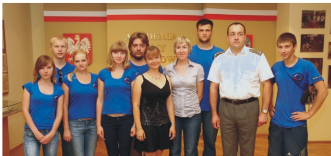
Практиканти PWT у музеї Варшавської Академії Народної Оборони