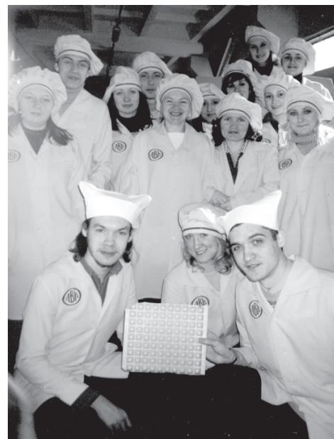
С вафельной плитой — основой «Шедевра»