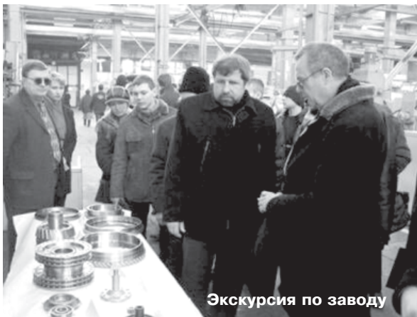
Экскурсия по заводу

ловиями быта, досуга и отдыха молодежи предприятия. А научные сотрудники и представители завода собрались на рабочее совещание, на котором рассматривались основные проблемы заводчан, а также научные направления, которые ведутся на кафедре ТМ. Состоялся обмен мнениями, в ходе которого были намечены перспективы дальнейшего сотрудничества