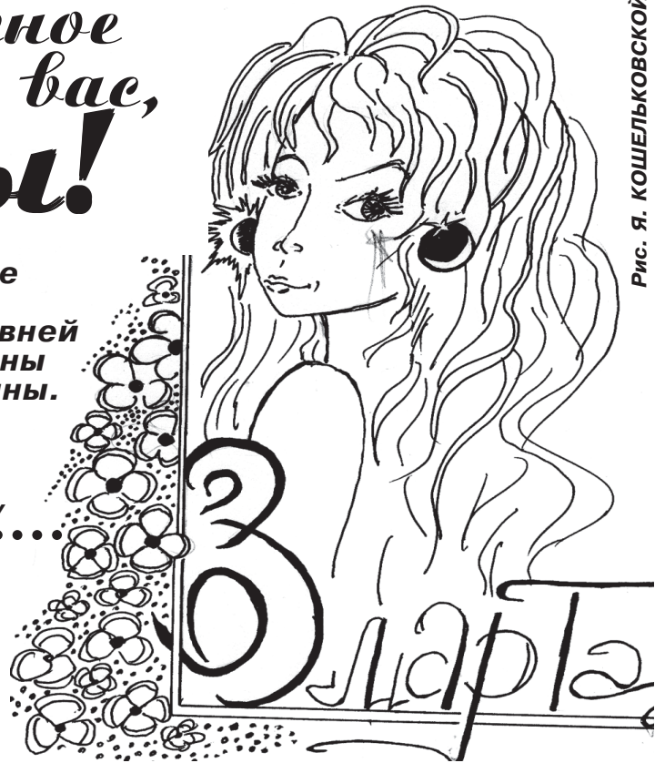
Рис. Я. КОШЕЛЬКОВОЙ

Бытует мнение, что атмосферные осадки, выпавшие в знаменательный для кого-то день, сулят удачу: молодожены будут жить долго и счастливо, открытия произведут сенсацию, а студенты, получившие дипломы, станут высококлассными профессионалами. Хочется верить, что эта примета имеет под собой почву - 12-е февраля, когда новоиспеченным магистрам ФВТИИ и ЭТФ вручали дипломы, выдалось на редкость снежным.