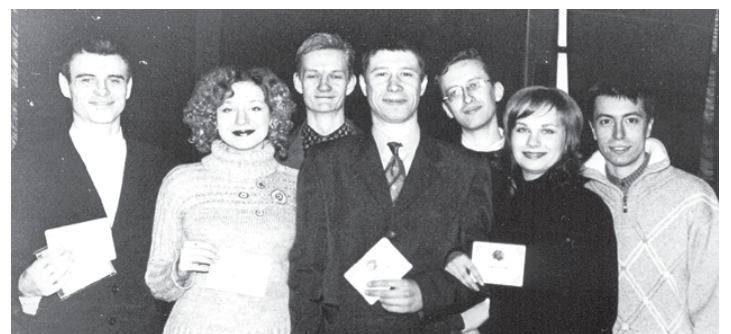
Магистры — 2004