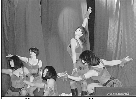
На сцене мюзикл «Чикаго»

Радиотехнический факультет поразили мастерским исполнением «Холли Долли» (это музыкальное произведение в итоге победило!), постановкой каламбуров и включе-