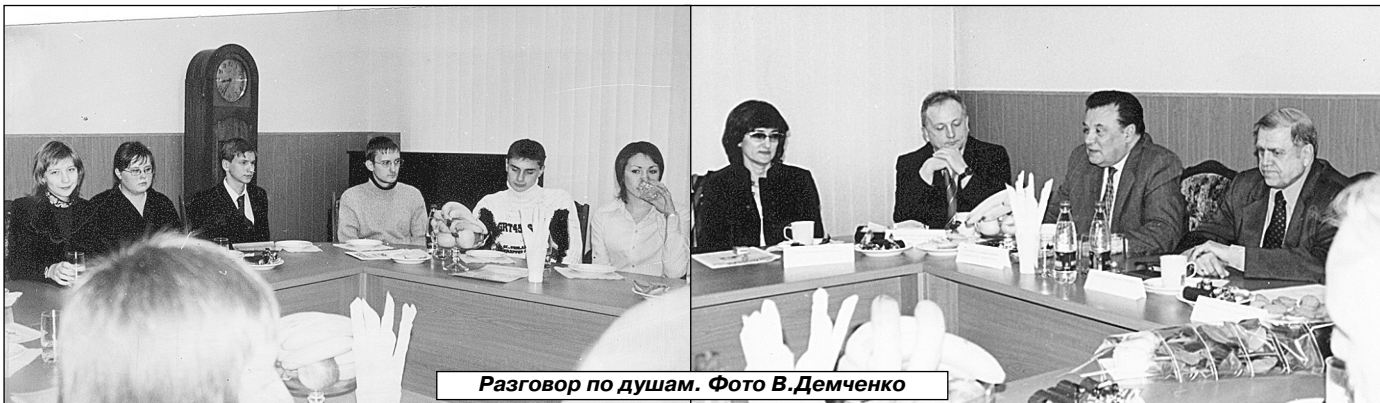
Разговор по душам.