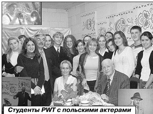
Студенты РПТ с польскими актерами

Среди высокопоставленных гостей был Генеральный Консул Польши Гжегож Серочиньски, специально приехавший из Харькова на открытие выставки. О серьезности и официальности приема свиде-