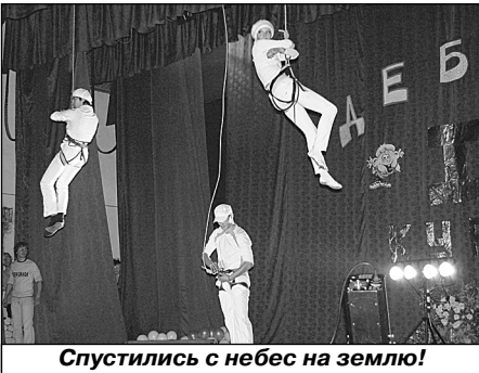
Спустились с небес на землю!

Командам каждого факультета предложено три возможности проявить себя: в песне, танце, выступлении команды КВН. Первокурсники электротехнического факультета поразили зрителей идеально синхронным танцем в ультрафиолете. Казалось, для выступавших парней отменили законы гравитации! Команда организовала фееричный EXIT сквозь бумагу. Шутки об Октябрьском безбашенном крае и «Валера. Псих» до сих пор вызывают улыбку. В конце выступления электротехники подарили всем своё взрывное сердце. Видимо, это и сразу сердца жюри, признавшего их Лучшими!