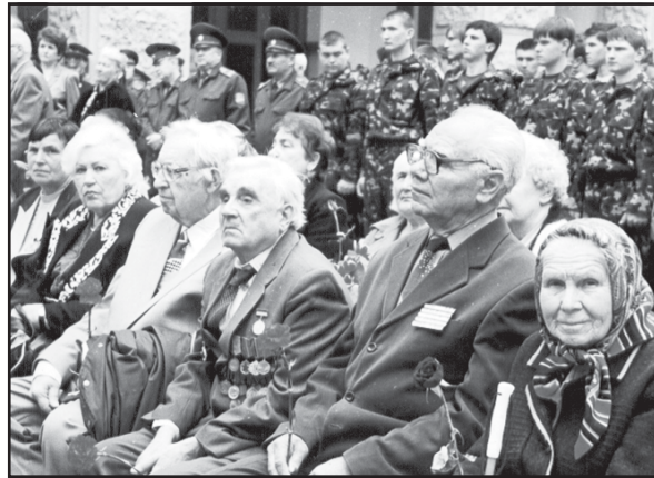
Снимки прошлых лет

Ваш геройский подвиг не забыть. Пусть года бегут неумолимо, Но сирени бархатная кисть В вашу честь цветет неопалима.