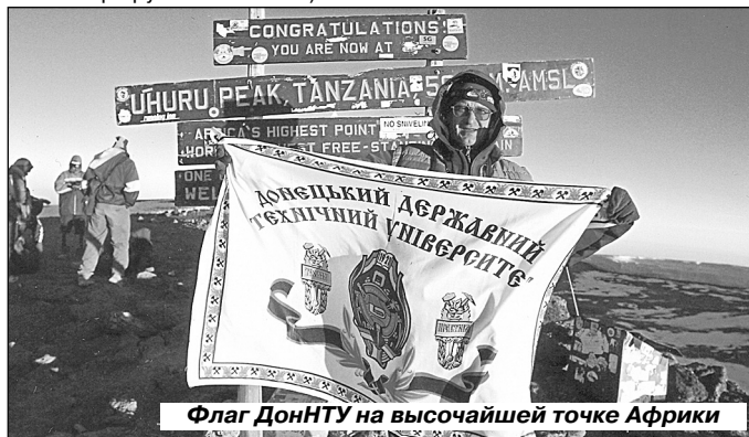
Флаг ДонНТУ на высочайшей точке Африки

Приключения начались в аэропорту столицы Кении Найроби. Оказалось, что часть нашего багажа затерялась, и один из участников остался без теплых вещей. А на вершине, хоть она и расположена почти на экваторе, мороз – -10...-15 °C с сильным ветром! Но искать пропажу некогда, написали заявление в адрес авиакомпании и отправились в длинное автобусное путешествие по Кении и Танзании в город Моши. Отсюда начинаются все маршруты восхождений на Килиманджаро. Мы выбрали самый живописный из них, который официально называется Мачаме, а неофициально – «Виски» (в отличие от самого простого маршрута «Кока-кола»).