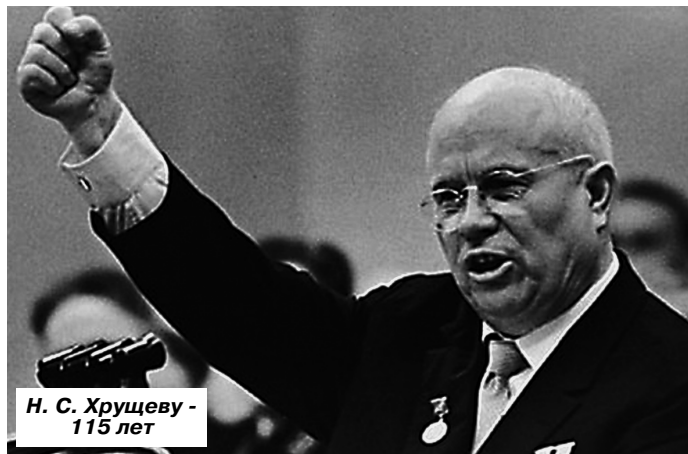
Н. С. Хрущеву - 115 лет