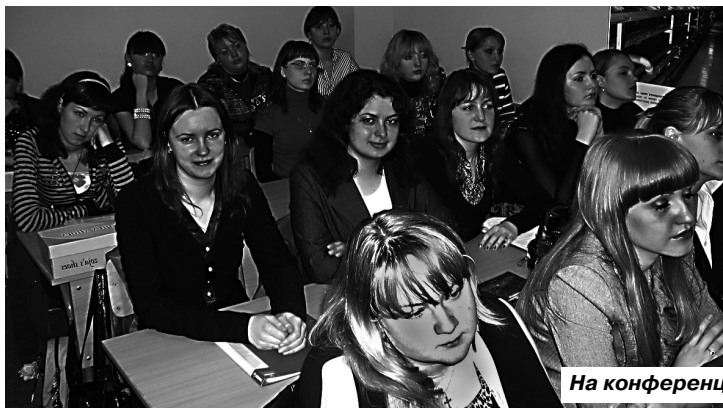
На конференції по екології