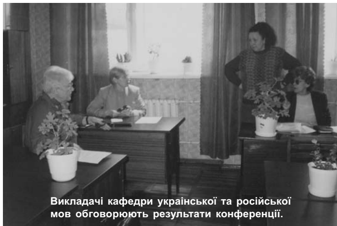
Викладачі кафедри української та російської мов обговорюють результати конференції.

на тому, що з'явився фактично шостий (Internet) стиль, який має декілька підстилів. Бо він синтезував окремі риси усного й писемного мовлення, розмовного, художнього, публіцистичного, наукового й офіційно-ділового стилів і в той же час - абсолютно самостійний. Крім того, етикет у звичайному для нас значенні часто ігнорується, бо кожна хвилина перебування в мережі оплачується, а контактів хочеться установити якомога більше. От і з'явився, поки неофіційно, Internet-етикет. По-друге, було