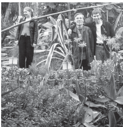
На экскурсии в Ботаническом саду