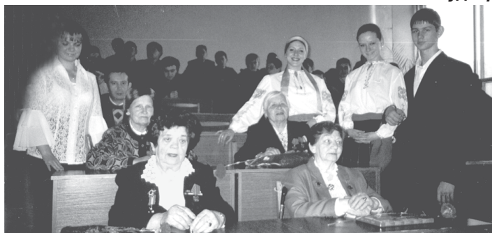
Ветеранам — внимание и любовь студийцев.