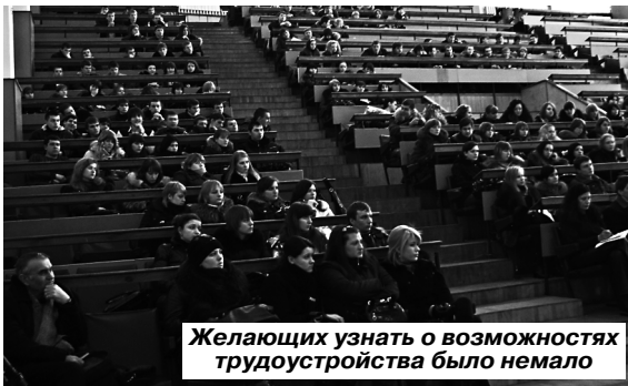
Желающих узнать о возможностях трудоустройства было немало

ты. Обучающая программа рассчитана на 8 академических часов и включает четыре блока: "Эффективные коммуникации и деловое общение", "Тайм-менеджмент, целеполагание и планирование", "Мотивы и мотивации", "Информация, информационные потоки" с выдачей сертификатов. Первые два тренинга состоялись 23 и 25 марта, следующие пройдут 27 и 31 марта. Те, кто не успел на них своевременно записаться, имеет шанс попасть на тренинг, если в указанные дни подойдут к 14.30 в аудиторию 9.510.