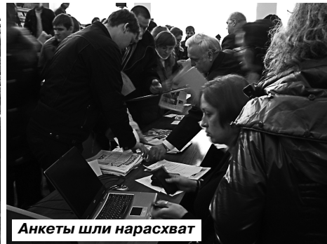
Анкеты шли нарасхват