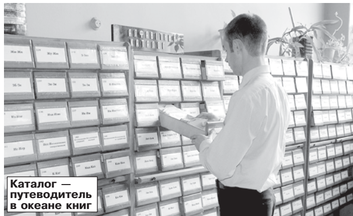
Каталог – путеводитель в океане книг

Стать читателем библиотеки просто: получи пластиковую читательскую карточку в деканате и приходи в сектор учета библиотеки для регистрации (3-й уч. корпус, 3-й этаж, ком. 333). Составь список не-