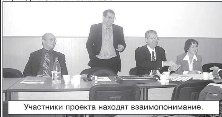
Участники проекта находят взаимопонимание.

Подробнее об этом проекте мы расскажем в следующем номере «Донецкого политехника».