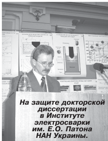
На защите докторской диссертации в Институте электросварки им. Е.О. Патона НАН Украины.