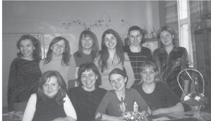
В группе ЭГ-016 день рождения каждого - праздник общий.

пределиться на две группы. И вот здесь в очередной раз сработал тезис «подобное притягивает подобное». Сами же студенты говорят: «Так получилось, что в одну группу объединились в основном те, кто хочет хорошо учиться». Вот они и доучились до того, что скоро отличниками станут все. По крайней мере, к этому девушки активно стремятся. Желаем им поставить такой рекорд!