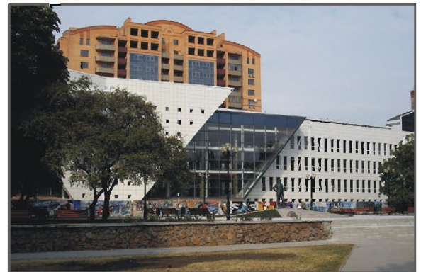
Будущий библиотечно-информационный центр