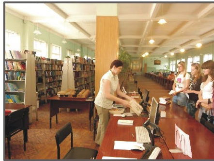
Автоматизированное обслуживание в Большом читальном зале

лиографические указатели, тематические справки), представлен доступ к мировым коллекциям информационных ресурсов. Кроме того, здесь много полезной информации: виртуальные выставки, консультации, наши объявления, правила и документы, другие