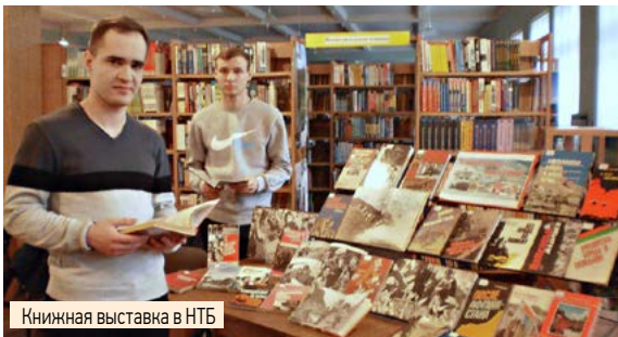
Книжная выставка в НТБ

В научно-технической библиотеке прошел цикл мероприятий «Солдат войны не выбирает», посвященный 30-й годовщине вывода советских войск из Афганистана. Сотрудники НТБ к этой дате подготовили мероприятие «В сердцах и книгах – память о войне», на котором студенты и преподаватели прочитали стихи о войне в Афганистане, воссоздавая картину того времени через поэтические произведения и видеофрагменты.