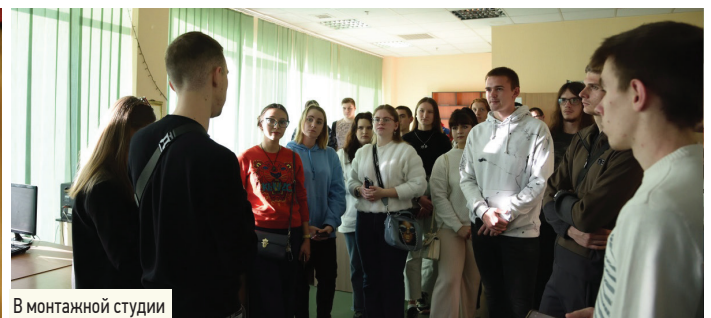
В монтажной студии