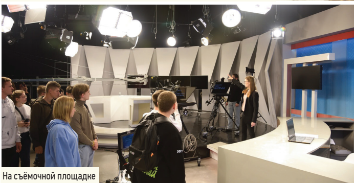
На съёмочной площадке