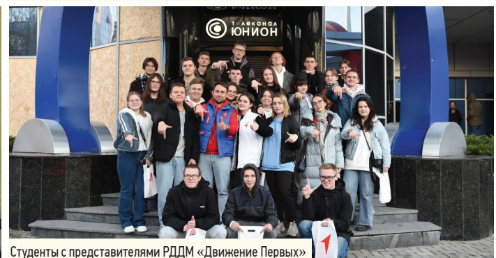
Студенты с представителями РДДМ «Движение Первых»