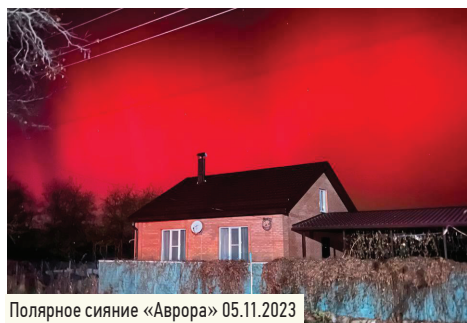
Полярное сияние «Аврора» 05.11.2023

5 ноября этого года в Донецке произошло чрезвычайное и необычное природное явление. Небо над городом окрасилось в яркий