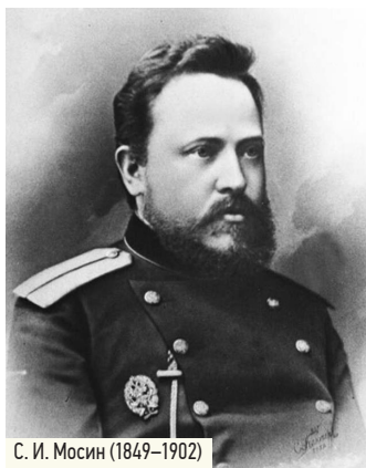
С. И. Мосин (1849–1902)

История винтовки Мосина пронизана битвами и сражениями, оставившими неизгладимый след в мировой истории. Даже те, кто совершенно далёк от темы оружия и войны, обязательно слышали о непревзойдённой «Мосинке». Это оружие стояло на страже в Первой и Второй мировых войнах, гражданской войне, войне в Афганистане. В разные годы более 30 стран использовали винтовки Мосина в своих армиях, а в общей сложности было выпущено свыше 37 миллионов стволов.