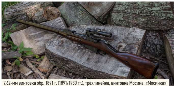
7,62-мм винтовка обр. 1891 г. (1891/1930 гг.), трёхлинейка, винтовка Мосина, «Мосинка»

Будущий конструктор-оружейник Сергей Иванович Мосин родился 14 апреля 1849 года в селе Рамонь Воронежской губернии. Благодаря стараниям его отца, бывшего солдата, семья была принята в ряды воронежского дворянства. Дворянин Сергей Мосин в 1867 году успешно окончил кадетский корпус, а затем продолжил обучение в артиллерийском училище в Санкт-Петербурге. А в 1872 году Сергея Ивановича произвели в чин поручика, и он поступил в Михайловскую артиллерийскую академию на технический факультет, набрав при поступлении высший балл.