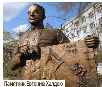
Памятник Евгению Халдею

интересное и познавательное мероприятие: я узнала много новых фактов и памятников! Больше всего понравилась станция про футуризм, презентация была невероятной! Прекрасное мероприятие для всех, кто хочет изучить историю, а ещё и хорошая возможность переключить внимание».