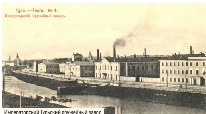
Тула.—Toula. № 4. Императорский Оружейный завод.

Заслуги Мосина в области оружейного дела были признаны государством: звание академика, должность начальника Сестрорецкого гарнизона, орден Святого Владимира III степени, серебряная медаль Александра II, бухарский орден Золотой Звезды III степени.