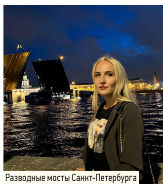
Разводные мосты Санкт-Петербурга

– У Вас есть опыт работы на посту председателя Совета молодых учёных. Все ли студенты могут быть молодыми учёными?