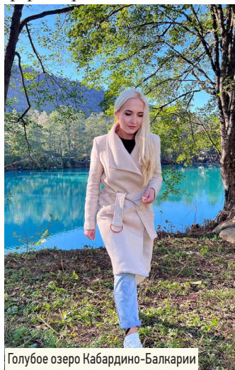
Голубое озеро Кабардино-Балкарии

– Моя магистерская работа была посвящена безопасности эксплуатации двухскоростного асинхронного двигателя. А диссертация стала своего рода её продолжением и родилась из поиска методов, которые помогут обеспечить безопасность человека, если он вдруг попадёт под действие обратной ЭДС со стороны двигателя при отключении питающей трансформаторной подстанции.